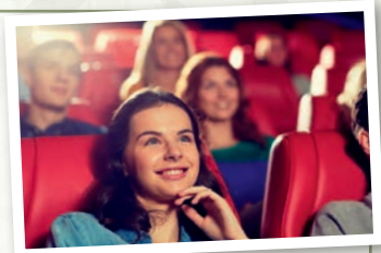
Im eigenen Kino wird die Geschichte von DIE KÄSEMACHER gezeigt.