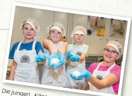
Die jungen „Käsemeister“