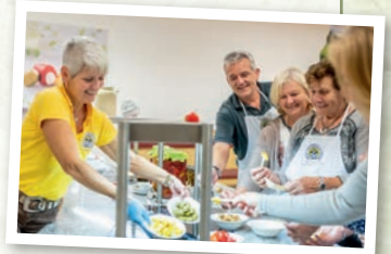
Zwischendurch: die leckere Verkostung unserer Spezialitäten