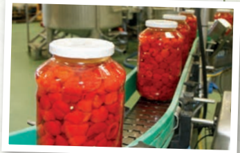
In der neuen Schauproduktion gibt es viel zu sehen.