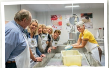
Mitten in der Minikäserei